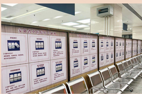
医院特色制剂展示柜

作为安徽省中医药文化科普基地，门诊持续加强中医文化氛围的打造，设置院内制剂展示宣传栏、宣传柜，特色膏方展示柜，让老百姓更加直观、深入了解我院特色优势。