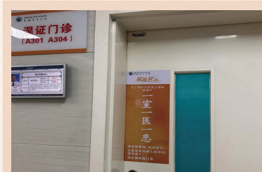
加强“一室一医一患”管理

门诊入口宣传栏，加强健康宣教；充实门诊便民服务箱，为老年人提供眼镜、充电器等物品。