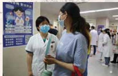
治疗完成后向病人交代注意事项